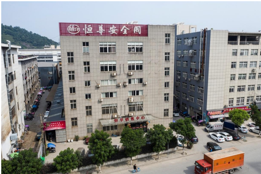
图 1-1 现代化厂区